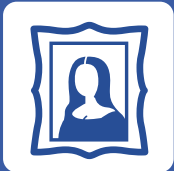
展覧会・各種イベント