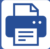
プリンタ(用紙は持参)