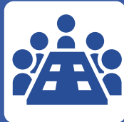
学内学生団体の活動