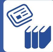
新聞・書籍(教授参考書等)