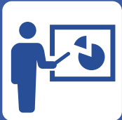
ゼミナールに準じた活動