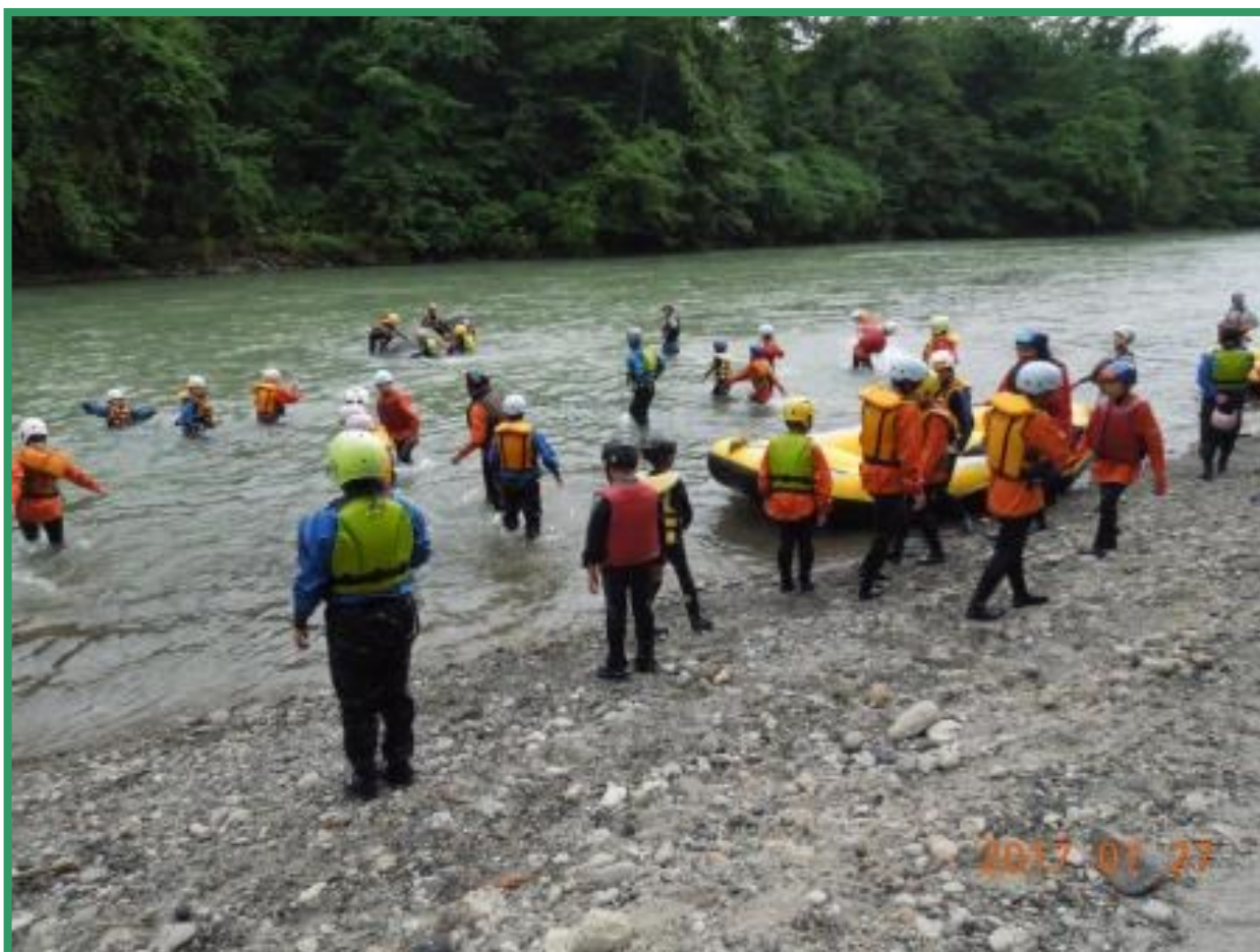
自然体験学習・川下りを行う十勝の子ども達

Email：ktm-wakamatsu-s2@Hokkaido.school.ed.jp